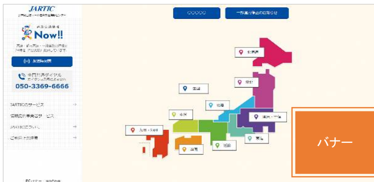
※関連する画面(地域選択)