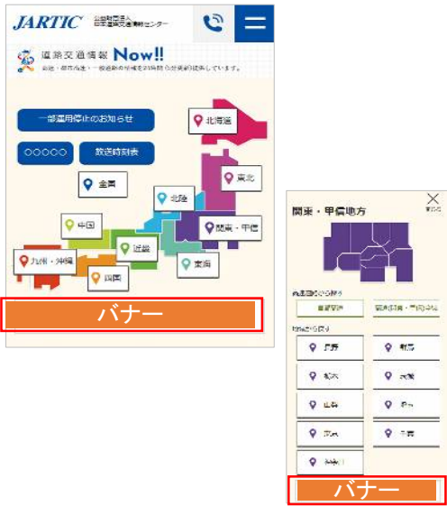
※関連する画面(地域選択)