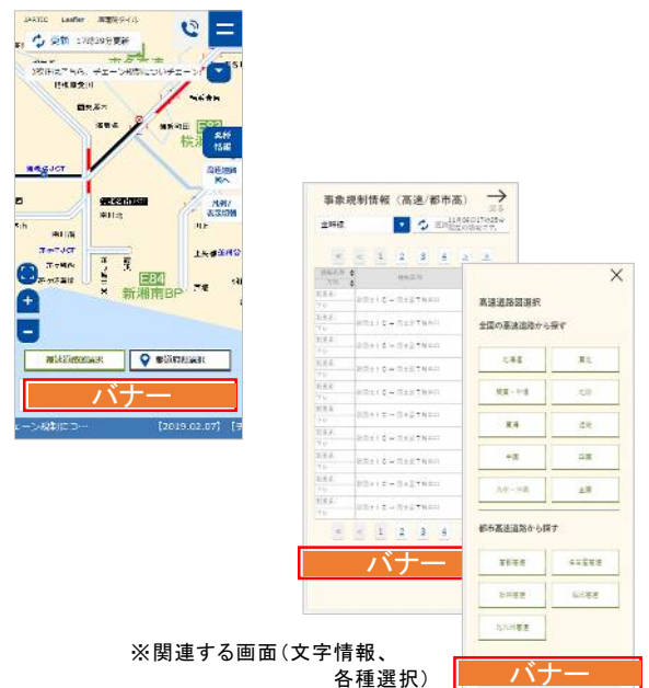
※関連する画面(文字情報、各種選択)