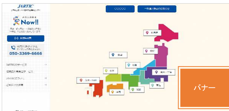
※関連する画面(地域選択)