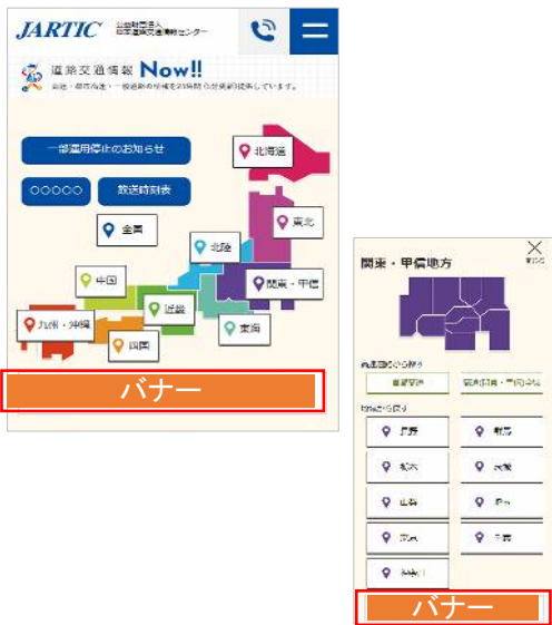
※関連する画面(地域選択)