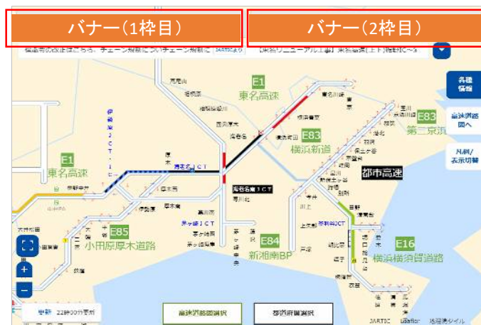
※関連する画面(文字情報、各種選択)